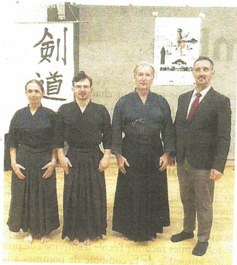
Quatre membres de la section kendo passaient des grades à Limoges